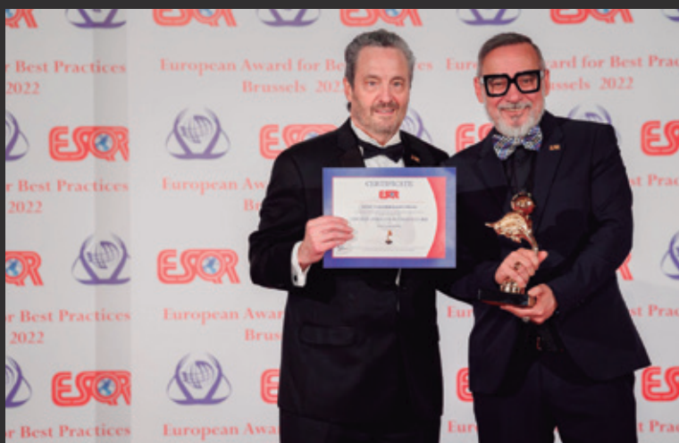
ADAAP, gestora da SP Escola Superior de Teatro, é homenageada em premiação em Bruxelas, na Bélgica