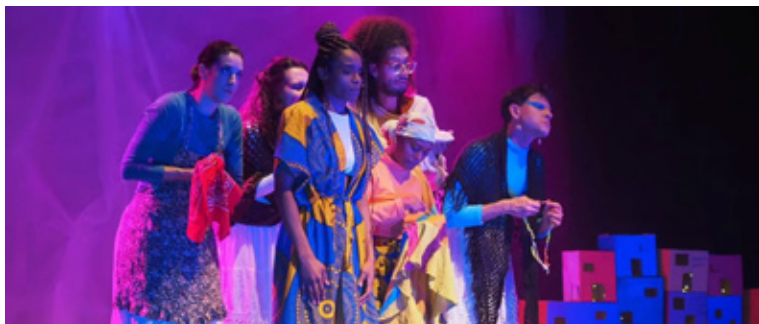
Estudantes da SP Escola Superior de Teatro Rio Maior, Portugal