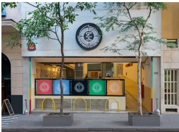
Unidades Brás (cima) e Roosevelt (baixo) da SP Escola Superior de Teatro