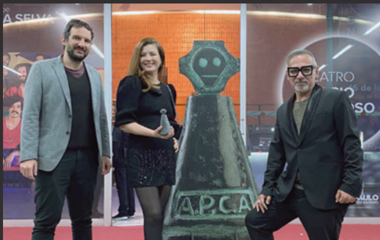
ADAAP, gestora da SP Escola Superior de Teatro, ganha Prêmio Especial da APCA