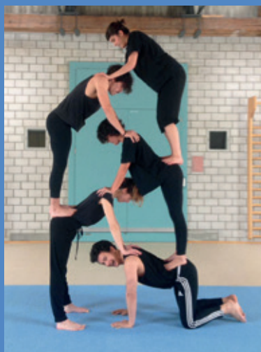
Estudantes da SP Escola Superior de Teatro durante aula de dança na Zurich University of the Arts (ZHdK), na Suíça