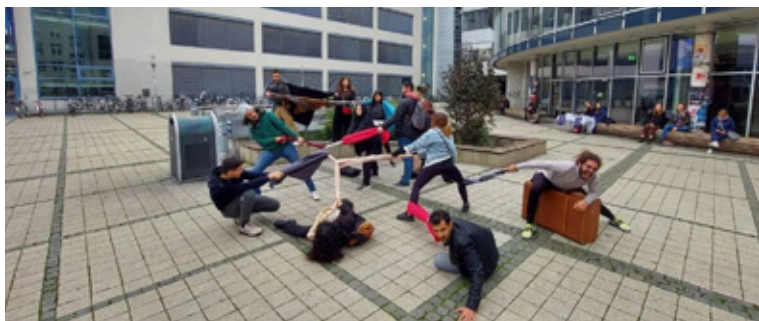
Estudantes da SP Escola Superior de Teatro em Jena, Alemanha