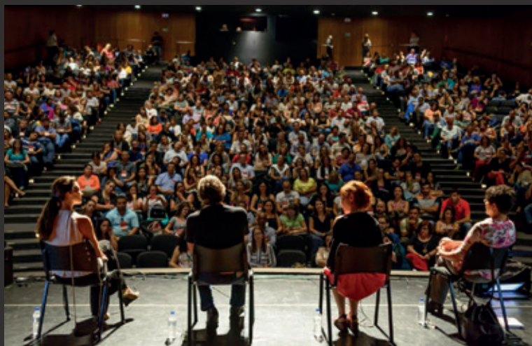
Palestra durante o lançamento do projeto Estação SP, no Teatro Sérgio Cardoso [foto: arquivo ADAAP]